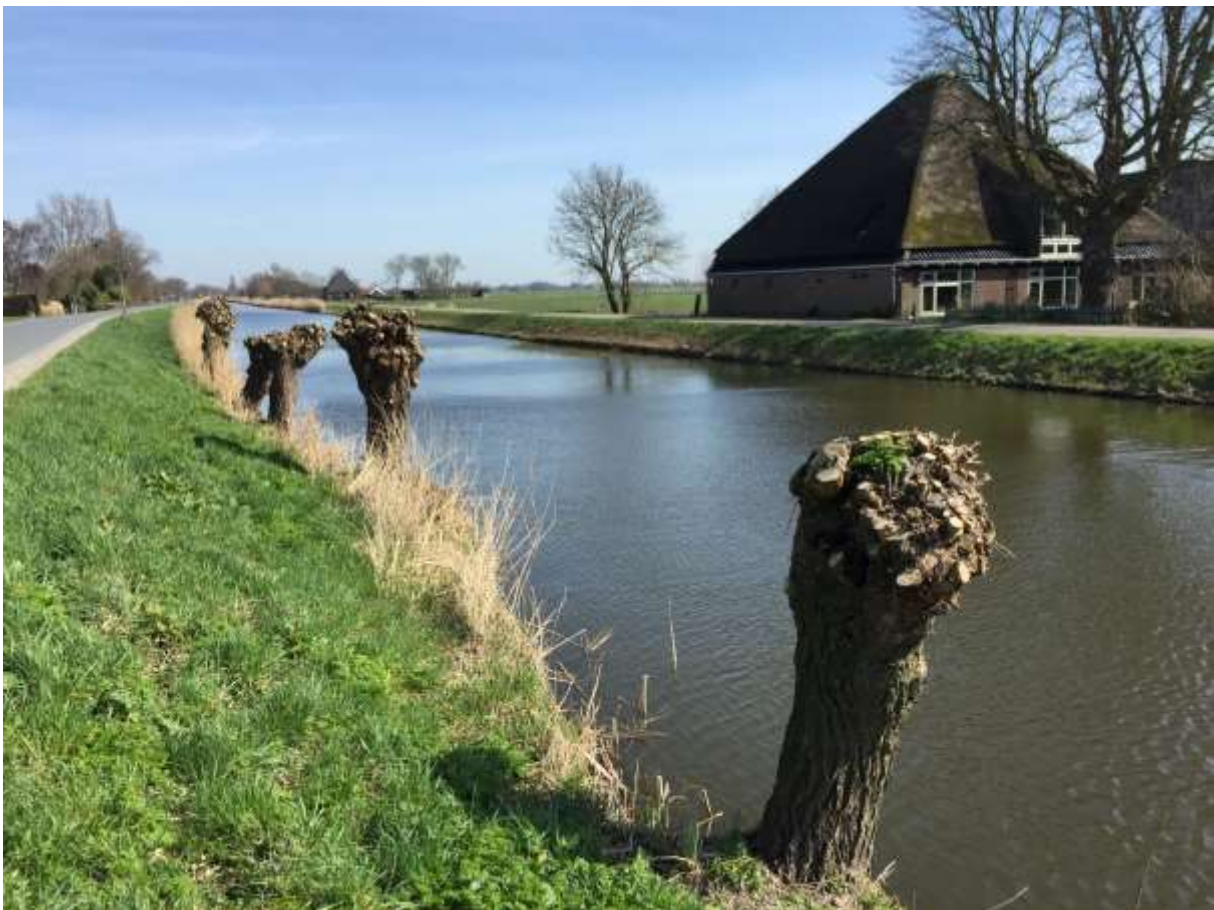
De Langereis. Het water is de scheiding tussen de gemeenten Hollands Kroon (links) en Opmeer. De bebouwing links valt onder Nieuwe Niedorp, die aan de overzijde onder Hoogwoud.

255. Maer sijden die voorscreven eijsschers ter contrarie dat indien die 256. voorscreven waeteringe gedempt gebleven ende schoon gemaect geweest hadde 257. het soude grootelijck geproffijteert 112 hebben, den landen van Hoochtwouw 258. des verweeders ondersaeten onder de selve waeteringhe gelegen 259. ende toegelaeten maer niet geconsenteert 113 dat die voorscreven verweerder