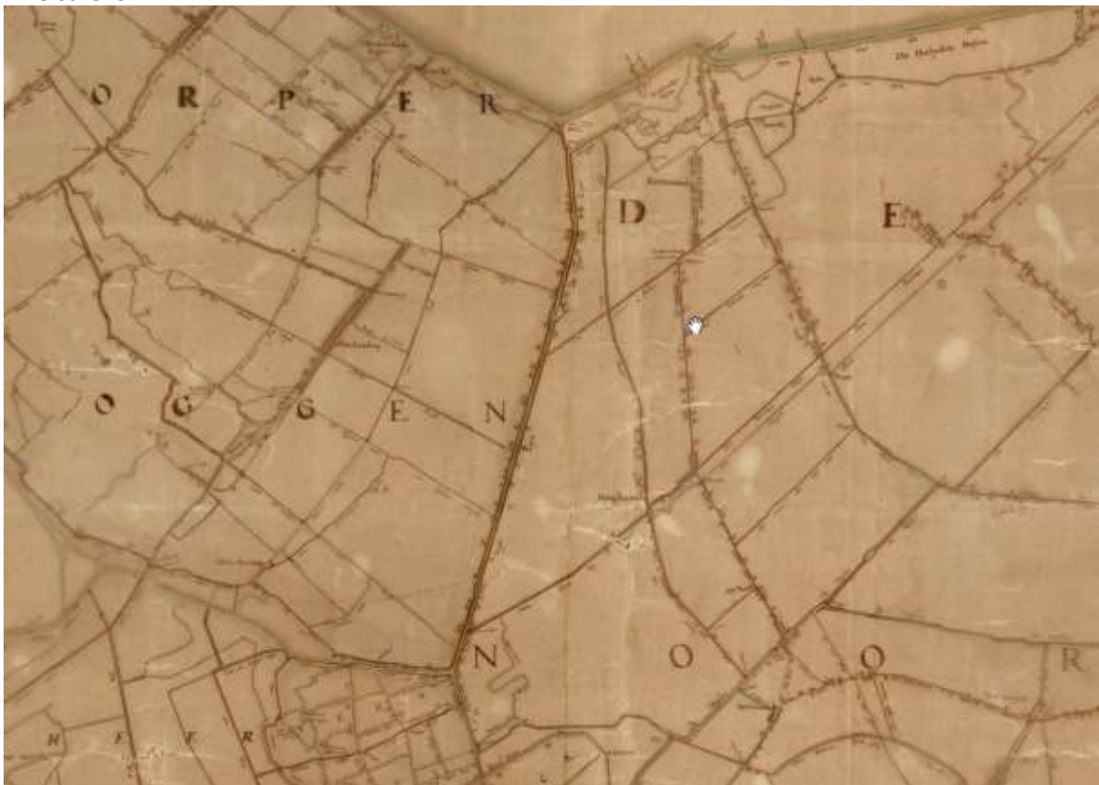
De Langereis (midden, van boven naar beneden) op een kaart van Johannes Dou uit de zeventiende eeuw. Het noorden is boven.

(Uitsnede uit de 'Grote manuscriptkaart van West-Friesland', opgemeten in de jaren 1651-1654; uitgebracht op de cd 'Noorderkwartier perfect gemeten' in 2005 door Hoogheemraadschap Hollands Noorderkwartier, Heerhugowaard, en Westfries Archief, Hoorn.)