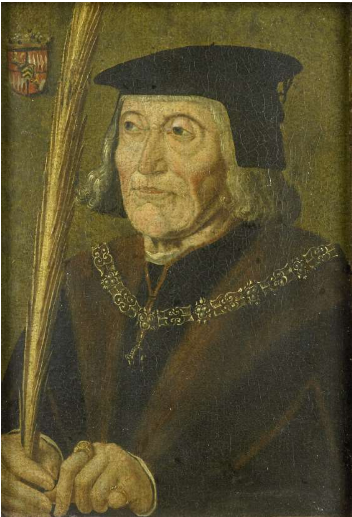
Jan III van Egmont (1438-1516), graaf van Egmond en stadhouder van Holland, Zeeland en West-Friesland. Hij werd in 1493 eigenaar van de heerlijkheid Hoogwoud en Aartswoud.